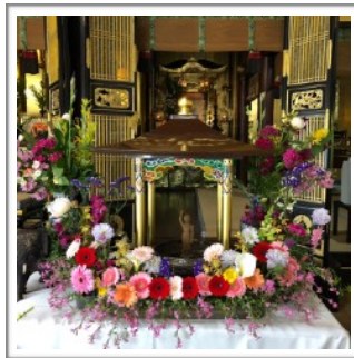
完成した美しい花御堂