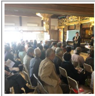
「元中通組蠟燭講」行事では 恒例のお楽しみ抽選会