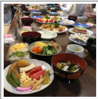
旬のお野菜で彩られた 美味しいおまかない