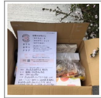
月忌参りやご法事で頂いた一部のお菓子は「おてらおやつクラブ」へ

今後の予定（6～7月） ご家族、ご友人の皆様お誘い合わせの上、どうぞお参り下さいませ